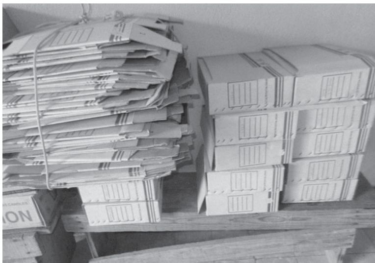
AGOSTO DE 2011